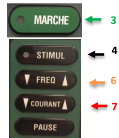
Interface Lifepak 15 et 20e