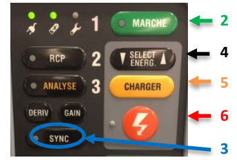
Interface Lifepak 15