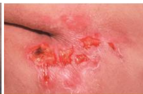
Lésions cutanées reliées à incontinence