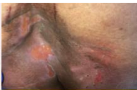
Zones difficiles / irrégulières