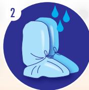
2 Mettre les jambières imperméables