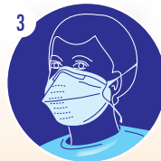
3 Mettre le masque N-95