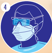
4 Mettre les lunettes de protection étanches