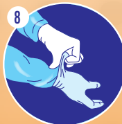
8 Mettre une 2 ème paire de gants de nitrile-XTRA longs SUR le poignet de la blouse