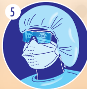
5 Mettre la cagoule ou le bonnet bleu