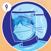
9 Mettre la visière complète