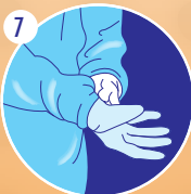
7 Mettre une 1 re paire de gants de nitrile-XTRA longs SOUS le poignet de la blouse