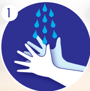
1 Effectuer l'hygiène des mains