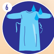
6 Enfiler la blouse imperméable